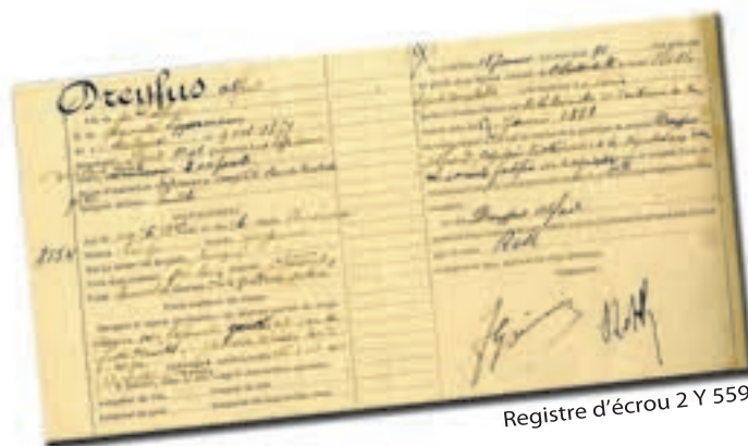
Registre d'écrou 2 Y 559