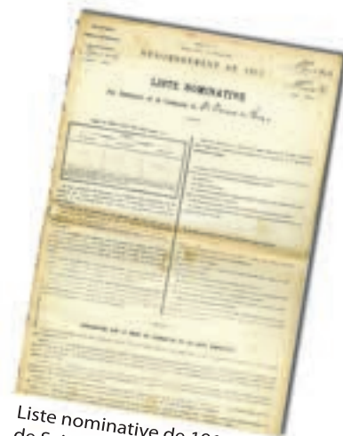
Liste nominative de 1911 de Saint-Denis du Pin 8 M 2

Consulter la série B (juridiction du siège royal et seigneurial) pour retrouver les registres de curatelle et de tutelle et les assemblées de parents. Les archives des hospices sont à consulter dans les séries H (clergé régulier) et C (administrations provinciales - intendances).