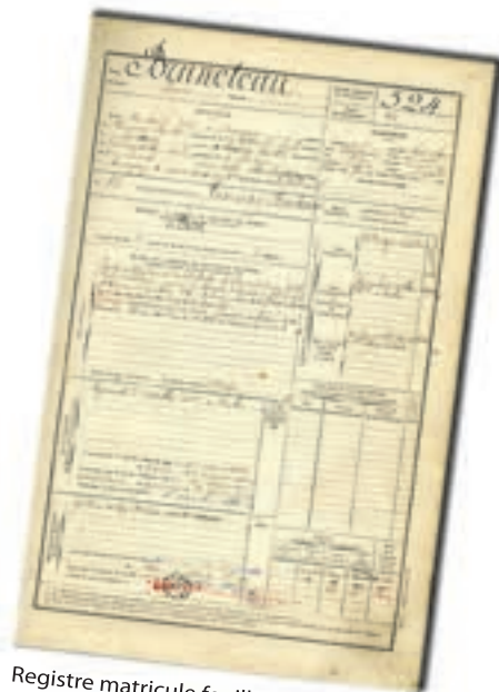
Registre matricule feuillet concernant le soldat Bruneteau 1 R 1015

Les registres matricules fournissent des renseignements très précis : état civil, signalement, décision du conseil de révision, corps d'affectation, détails des services et des mutations, blessures, citations et décorations et changements d'adresses.