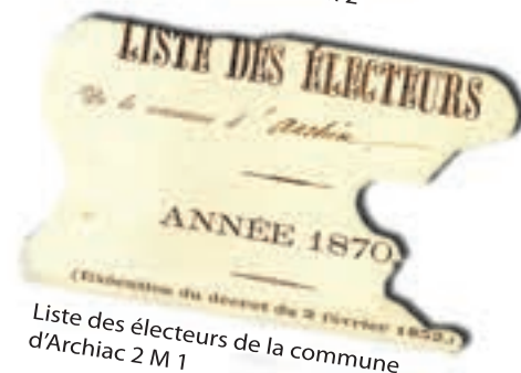
Liste des électeurs de la commune d'Archiac 2 M 1

Les registres matricules fournissent des renseignements très précis : état civil, signalement, décision du conseil de révision, corps d'affectation, détails des services et des mutations, blessures, citations et décorations et changements d'adresses.